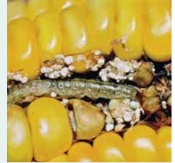
Maiszünslerraupe im Kolben

Der Maiszünsler ist der bedeutendste Schädling im Mais und mittlerweile in allen Teilen der Schweiz verbreitet. Die Maiszünsler-Larven dringen ab Ende Juni in die Maisfahne ein und bohren sich im Verlaufe der Vegetationsperiode im Stängel nach unten, wo sie an der Basis ihr Überwinterungsquartier suchen. Zurück bleibt der deutliche Schaden: geknickte Stängel und Fahnen sowie angefressene und schlecht ausgebildete Kolben bringen Ertragsverluste und erschweren die Ernte. Ausserdem stellen die Bohrstellen Eintrittspforten für Pilze dar, welche für Mensch und Tier gefährliche Pilzgifte (Mykotoxine) bilden können.